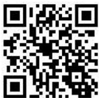
海山環境教育 FB 粉絲專頁