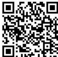
用心飲食救地球 NO.30 海山急診室