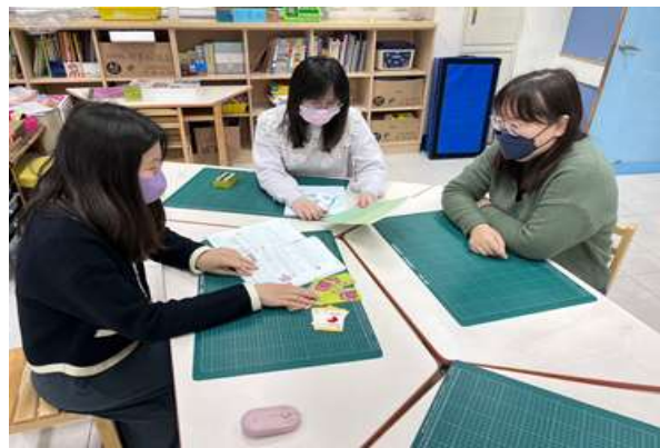
教具使用 (附件與分數撲克牌)