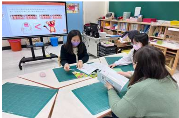
教案討論 (分數教學活動)