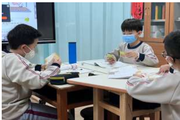
分數撲克牌教學活動