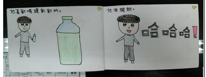
手做繪本小書，描述媽媽的小祕密的同時，也獻上最真摯的祝福與感謝