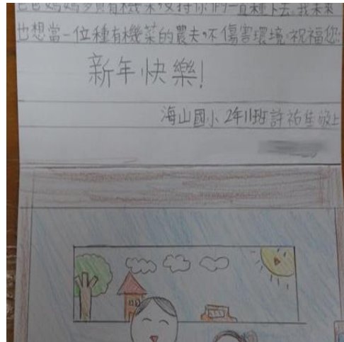
上傳檔案： 愛護小生物學習單.pdf