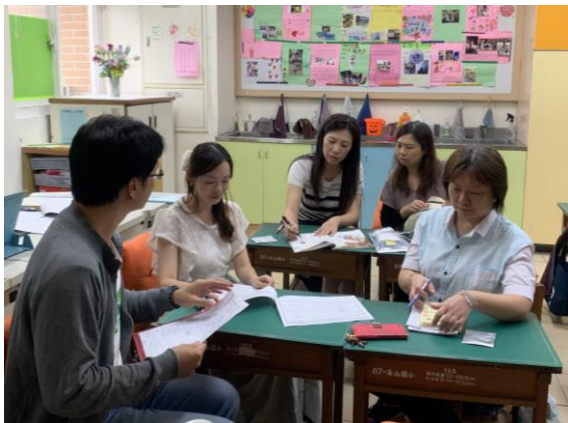
開心共備 討論奉茶

回顧從 4 月開始，共備共識後分工撰寫計畫，9 月開學百忙中撥空細部討論、分組共備，經過一連串簡報設計、教具準備、公開授課、修正教案、發布全校實施、結案報告撰寫、經費核銷等，一路走來實在不容易，環境教育工作坊約 20 人的團隊必須分組分工、團隊和合，見縫插針抽出時間共備，彼此包容、相互感恩，共同成就這美好的課堂風景。