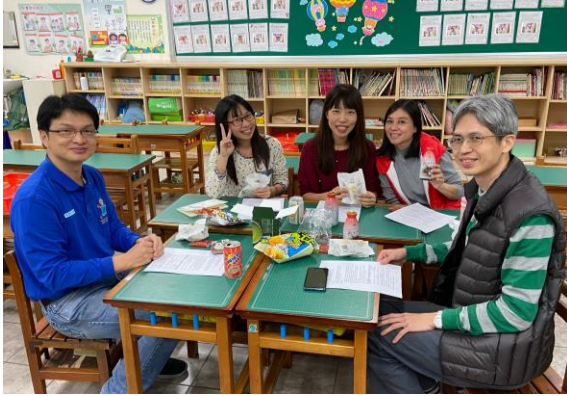
有吃有喝 快樂共學

一個人走一百步很快，一百人手牽手走一步影響很大。在教學生涯能遇到一群善友，同心同願共同為孩子的未來這個理想打拼，不重物質成就，重視品德教育—感恩惜福，感動自己、感動學生、感動家長，也感動了農夫，共同營造健康和樂的社會！