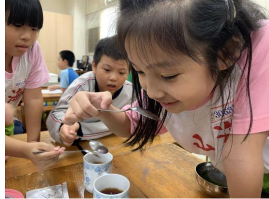
學生專心品茶神情