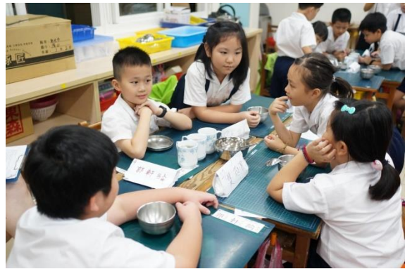
公開授課 小組討論品茶結果

工作坊伙伴提到「這課程很棒！從愛地球、愛環境到最後回到自己本身，很喜歡收尾的感覺。很感謝伙伴一起共備出來的教案和資源，謝謝各位伙伴的協助！」