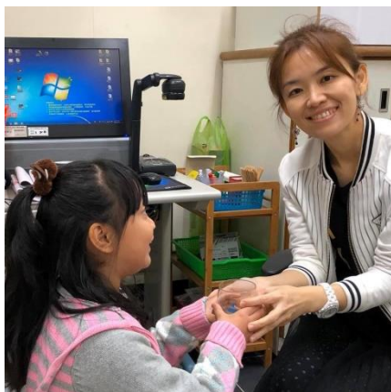
教師引導學生練習奉茶