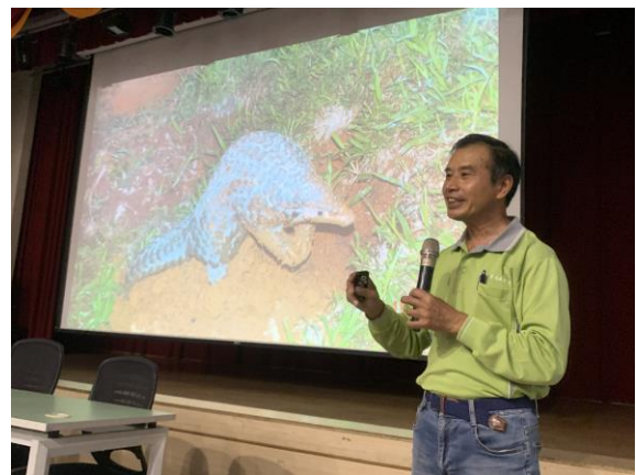
分享有機茶園的生物多樣性