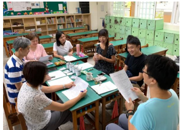
開心共備 討論學泡茶