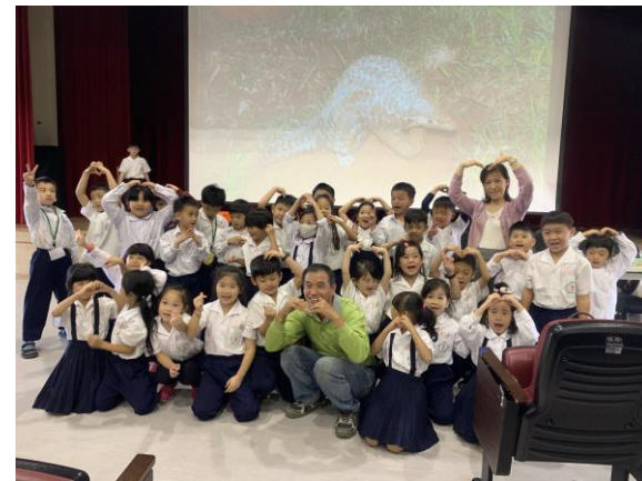
開心和農夫老師大合照