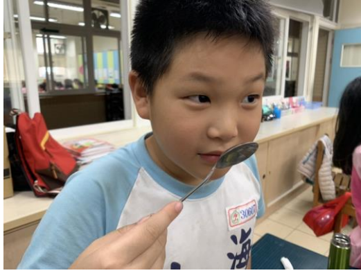
學生專心品茶神情