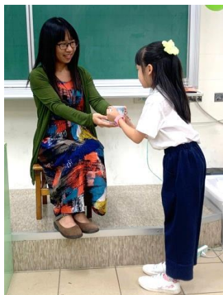
製作奉茶示範教學簡報