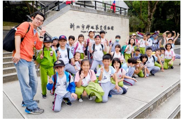
參觀新北市坪林茶業博物館