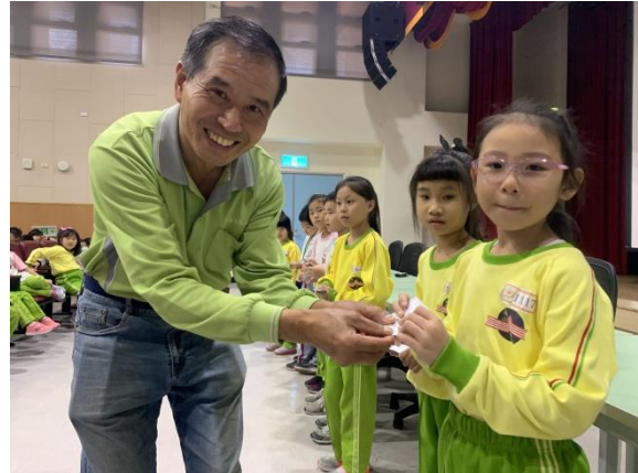
學生現場心得回饋後贈送有機茶