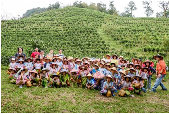
到坪林綠光農園體驗採有機茶