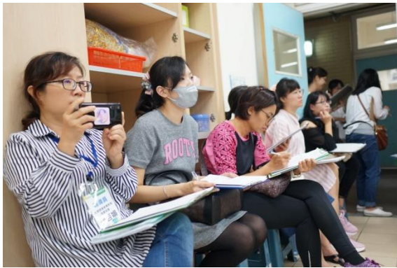
公開授課 以修正教案