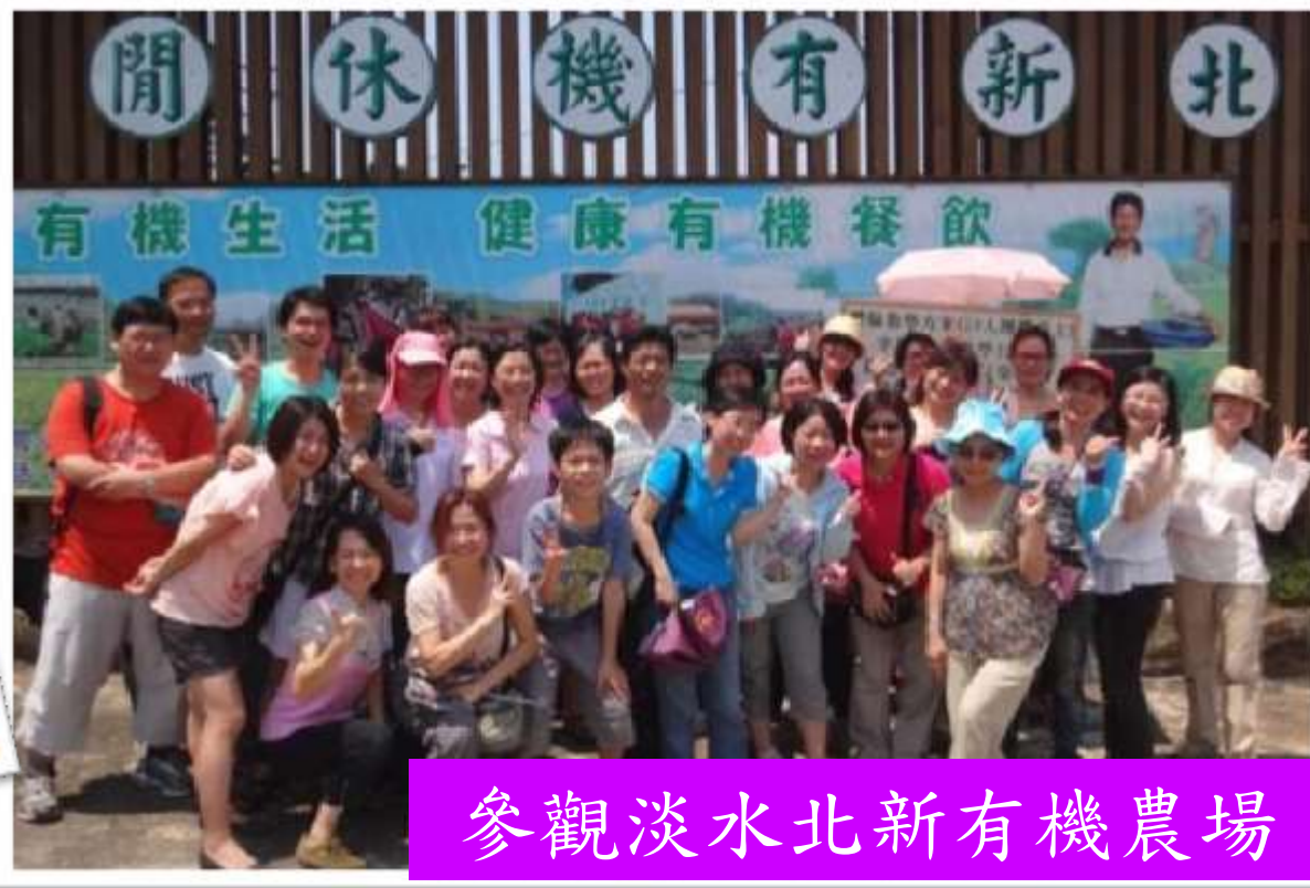
參觀淡水北新有機農場