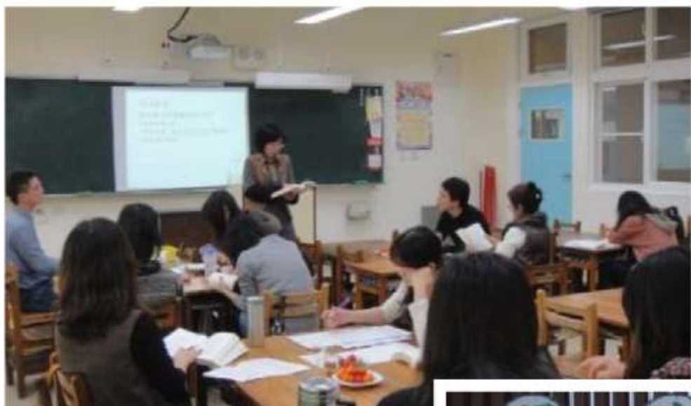
教師輪流導讀專書