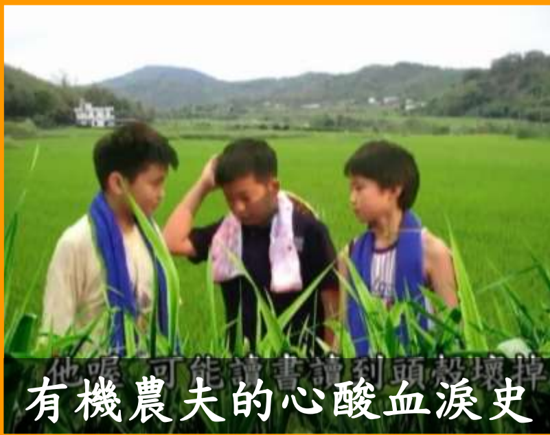
他呢可能讀書讀到頭殼壞掉 有機農夫的心酸血淚史