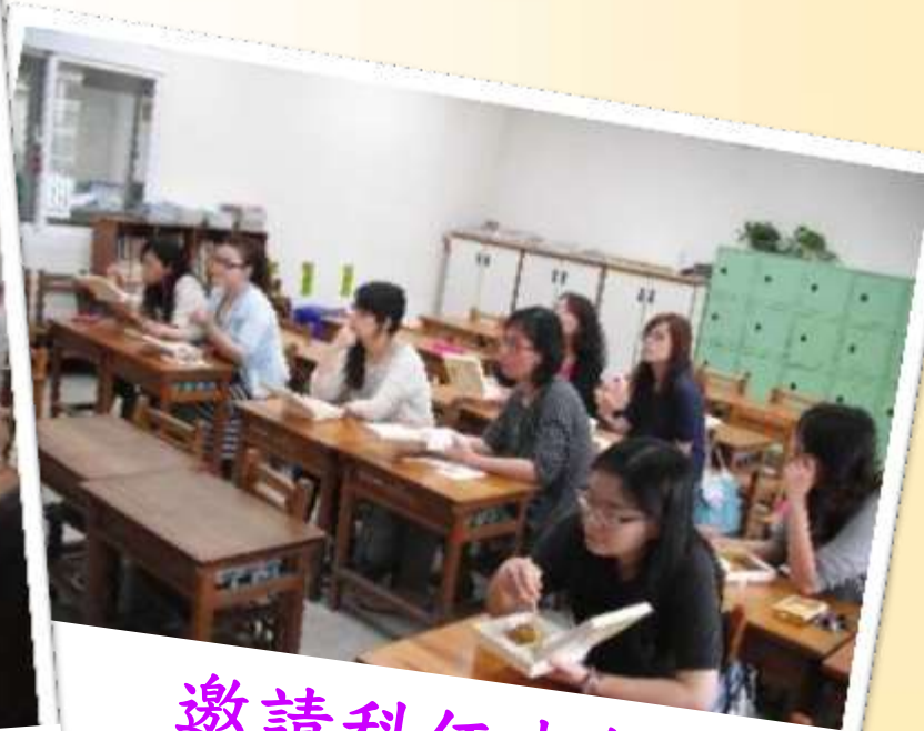
邀請科任老師參加