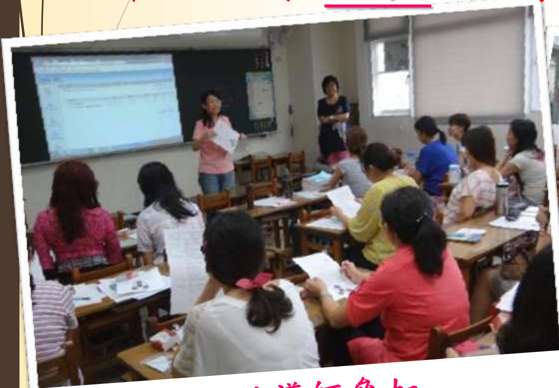
學年會議邀請導師參加