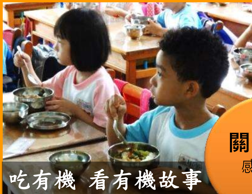
吃有機 看有機故事