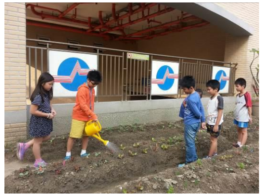
學生利用下課時間細心照顧