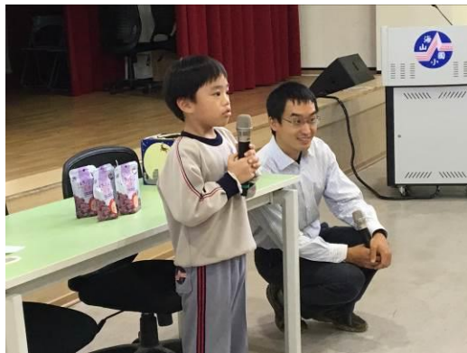
學生現場回饋有機農夫