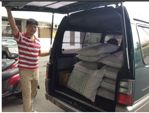
到板橋農會倉庫購買有機肥 2 號