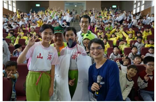
有機農夫蒞校演講