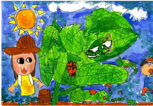
感恩卡-學生優良作品