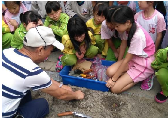
何添財先生(左)指導學生種菜苗