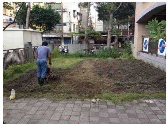
黃姓夫婦使用中耕機翻土