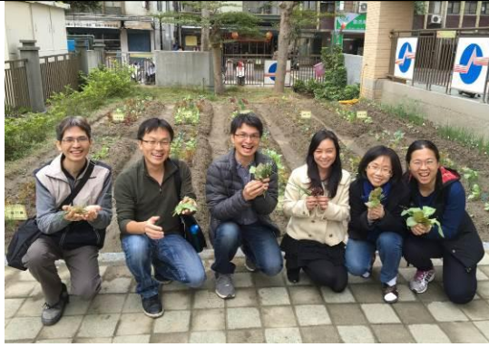
老師們快樂慶豐收