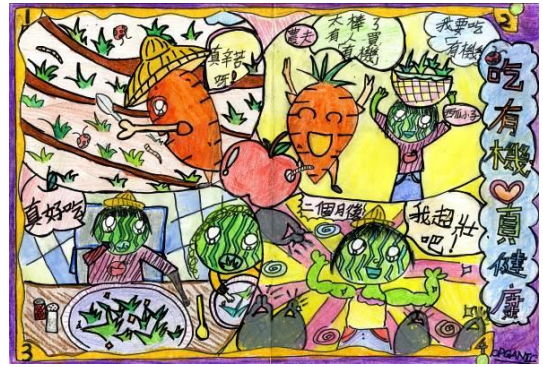
感恩卡-學生優良作品