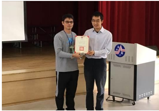
有機農夫蒞校演講