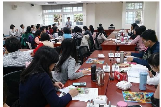
「小小食農種出好品格」跨縣市研習