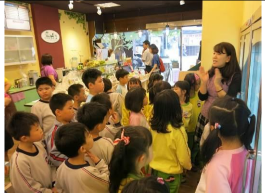
參觀有機商店-綠色大帝