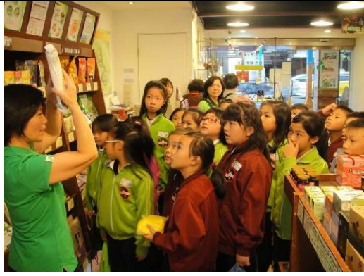
參觀有機商店-里仁