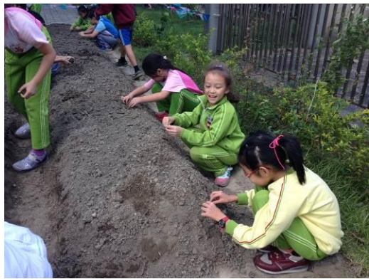
風沙雖大 就是要撿石頭